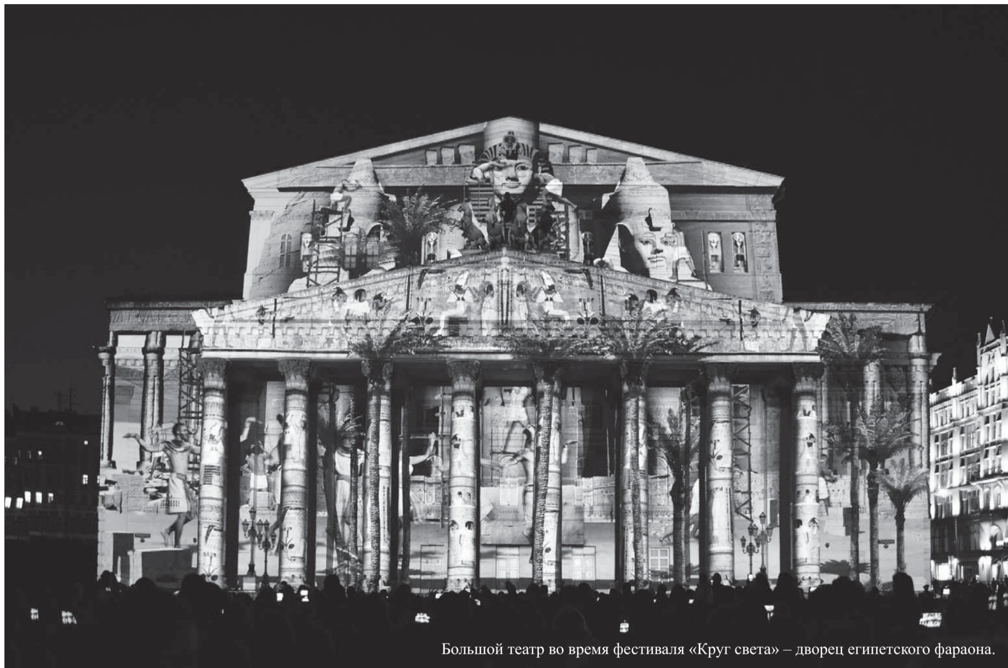
Большой театр во время фестиваля «Круг света» – дворец египетского фараона.